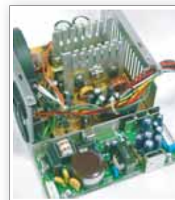
待测品多轨温度, 直流电压(DC) 交流电压(AC)量测